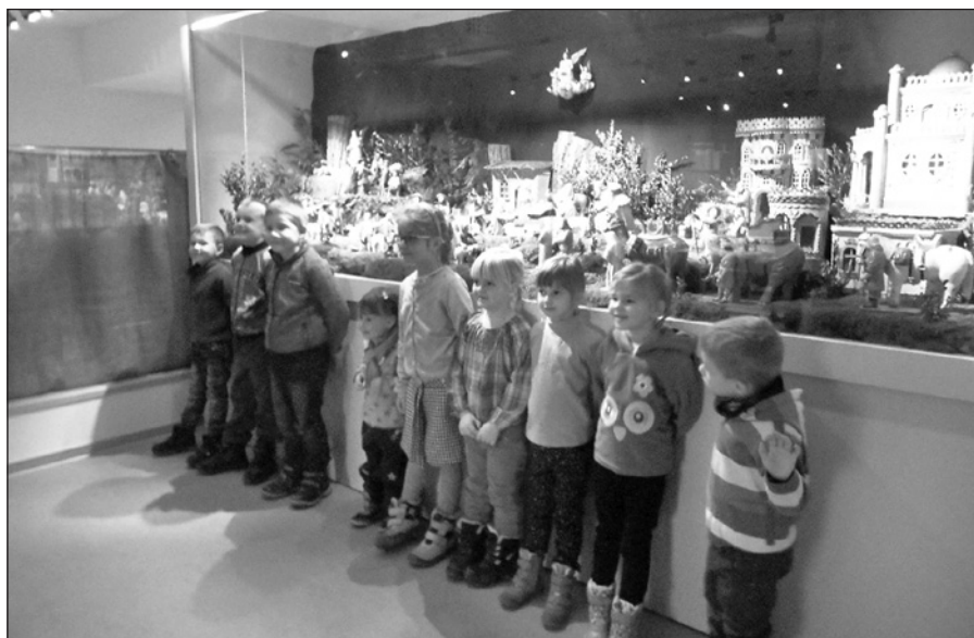
Třebechovický Betlém patří k Vánocům