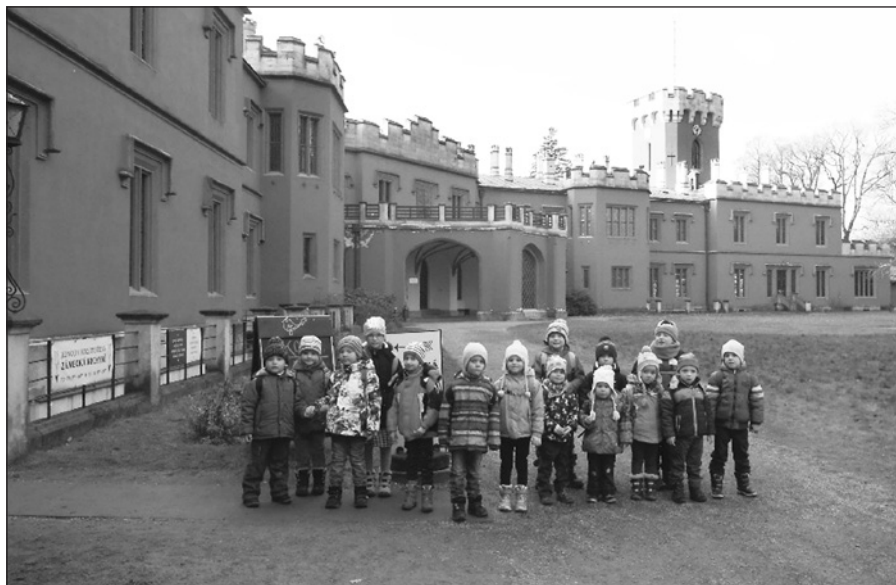
Již 13. adventní výlet – tentokrát do Hrádku u Nechanic