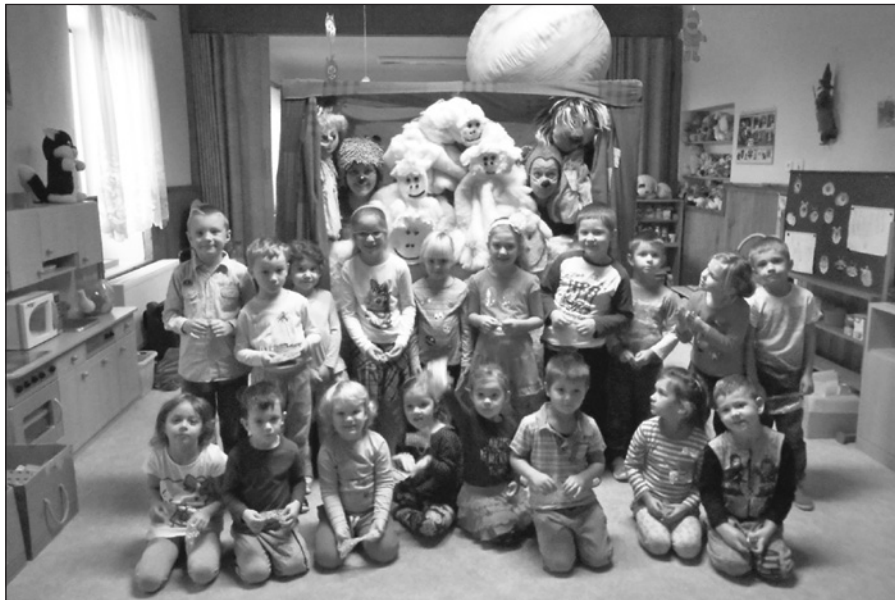
Advent odstartovala pohádka „O sněhové vločce“

Kalendářní rok 2017 se blíží ke svému závěru, poslední měsíc si užívají především naši nejmenší. Aby jim těšení na Ježíška a otvírání okének v adventním kalendáři co nejrychleji utíkalo, snažíme se dětem pobyt v mateřské škole vedle práce zpestřit zábavou, hrou a již tradičním adventním výletem.