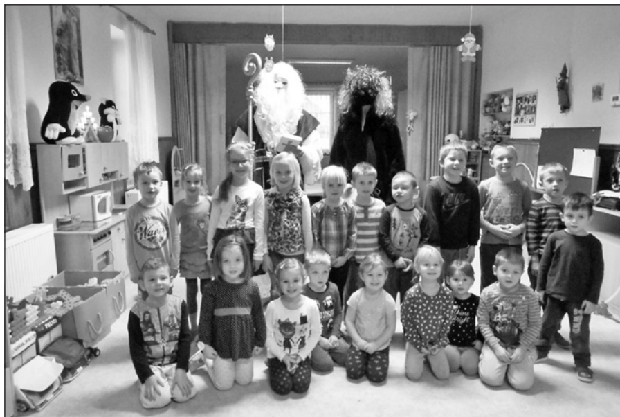
Přišel i Mikuláš s čertem