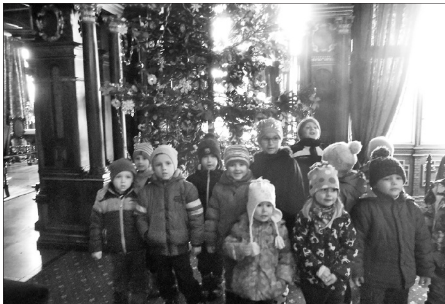
Vánočně vyzdobený zámek se nám moc líbil